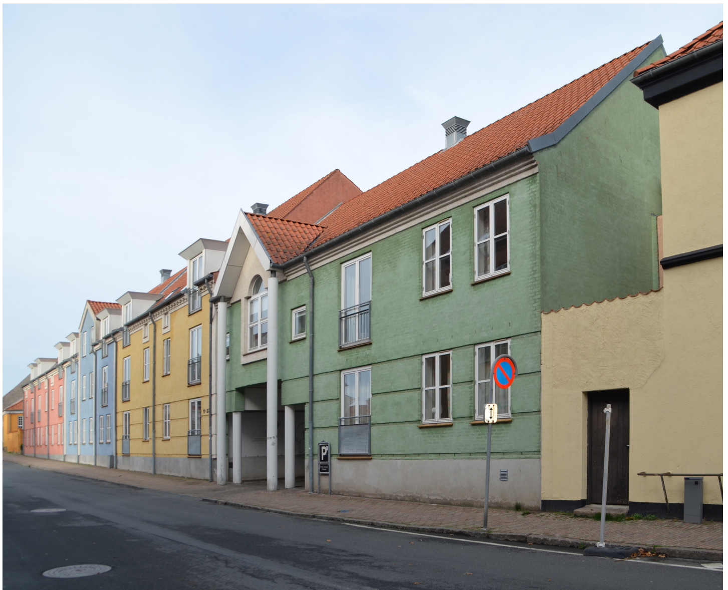
Uffe Harrebeks Tegnestue: Almene boliger Vestervoldgade 11-23 i Nyborg fra 1994

Facadens postmodernistiske tilhørsforhold kommer særlig tydeligt til syne ved porten og indkørslen til gårdsidens parkeringspladser og ankomster til lejlighederne. Ved hjælp af klassicistiske stilelementer er her skabt en postmoderne komposition symmetrisk om en midterakse, hvor to runde søjler bærer en gavltrekan, hvorunder der er placeret et postmoderne, kvadratisk vindue delt af et kryds i fire lige store ruder. Den ironiske distance til historicismen finder vi på toppen af de to søjler, hvor den traditionelle kapitæl er erstattet af en tynd stålstang, og ved foden af lisenerne, hvor det traditionelle fundament er trukket tilbage, og lisenerne svæver i luften.