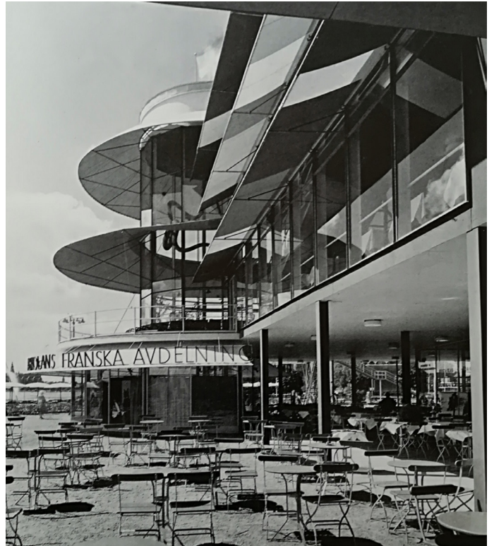
Erik Gunnar Asplund: Stockholmsudstillingen 1930.

Den nationale, funktionelle tradition fra slutningen af 1930'erne til slutningen af 1950'erne var præget af blandingen af modernismens grundidéer med dansk