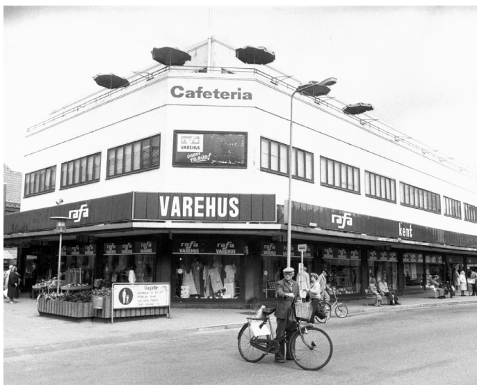
Varehuset, Gammel Torv 2, omkring 1978.

indvielsen ét stort varehus gennem fire etager inkl. kælder. Varehuset havde hovedindgang fra torvet i husets forside, og ud for hovedindgangen var der i husets modsatte side en stor åben trappe, der løb gennem alle fire etager og som bagtæppe havde et stort, vertikalt vinduesparti ud mod Lille Kongegade. Den øverste etage med udgang til tagterrasse blev i 1966 indrettet til cafeteria; alt sammen et tilløbssted for byens borgere.