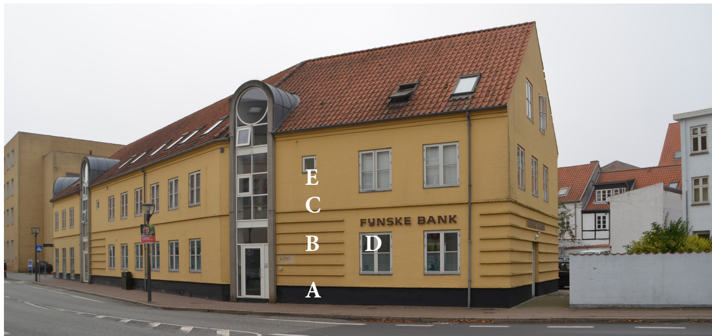
Hjørnehuset Nørregade 19-Baggersgade 7, 2022, tegnet i 1988 af Jørgen Stærmose K/S.