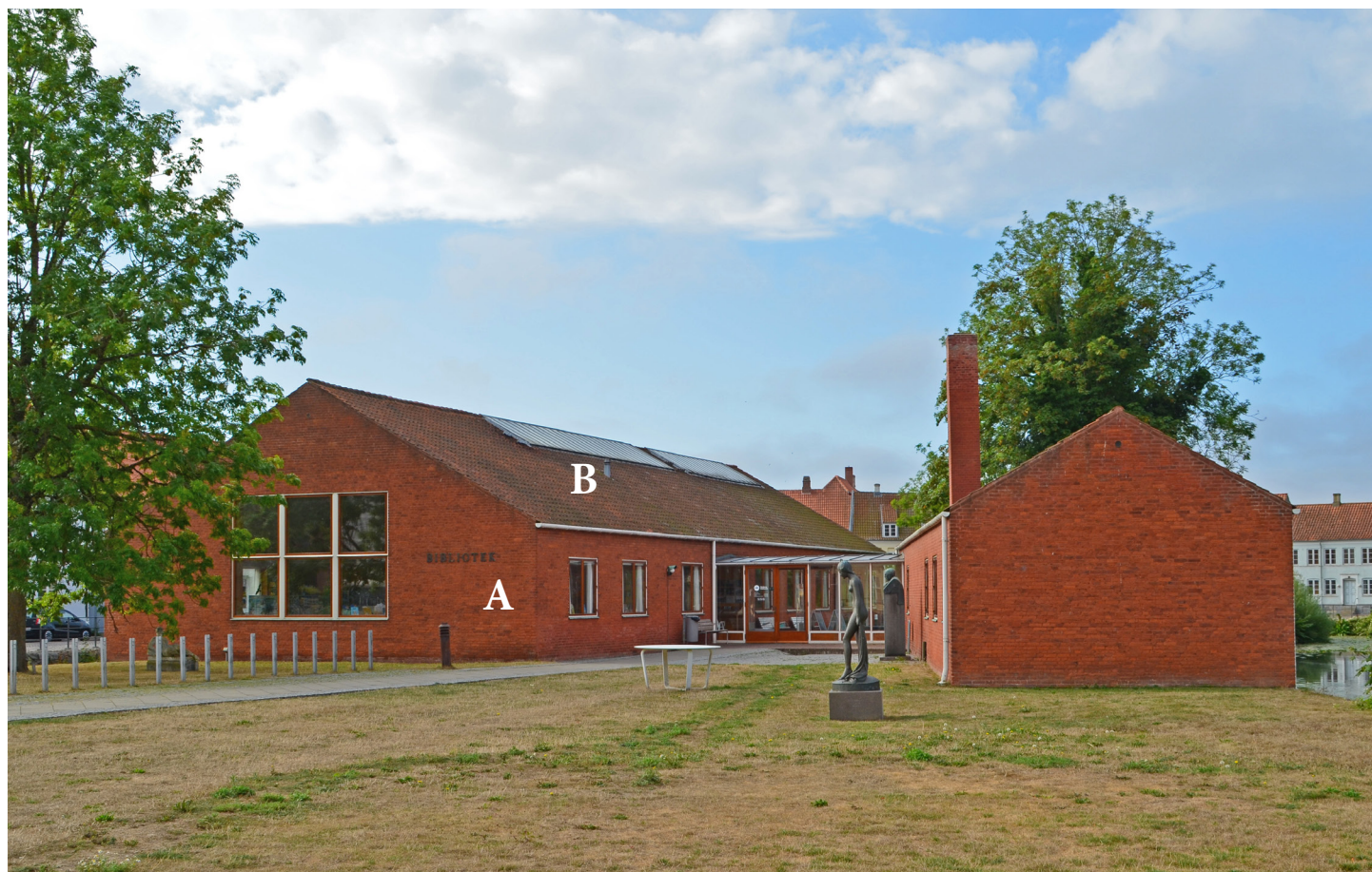
Nyborg Bibliotek, 2022.

Med Nyborg Bibliotek 1939 kom den danske funktionelle tradition til Nyborg. Biblioteket består af to hovedfløje holdt i rødt tegl såvel tage som facader. Fugerne i murværket er tonet i samme røde teglstensfarve, fløjene er uden sokkel og uden tagudhæng, kun en tagrende bryder indtrykket af, at husene er skåret ud af én stor rød teglstensblok, hvori der er skåret huller til vinduerne. Disse to skarpt skårne teglstensfløje er drejet i forhold til hinanden, så de følger voldgravenes stensætninger på hver side af byggegrunden, og de forbindes af et indgangsparti af glas. Alt sammen præcist, raffineret og beskedent.