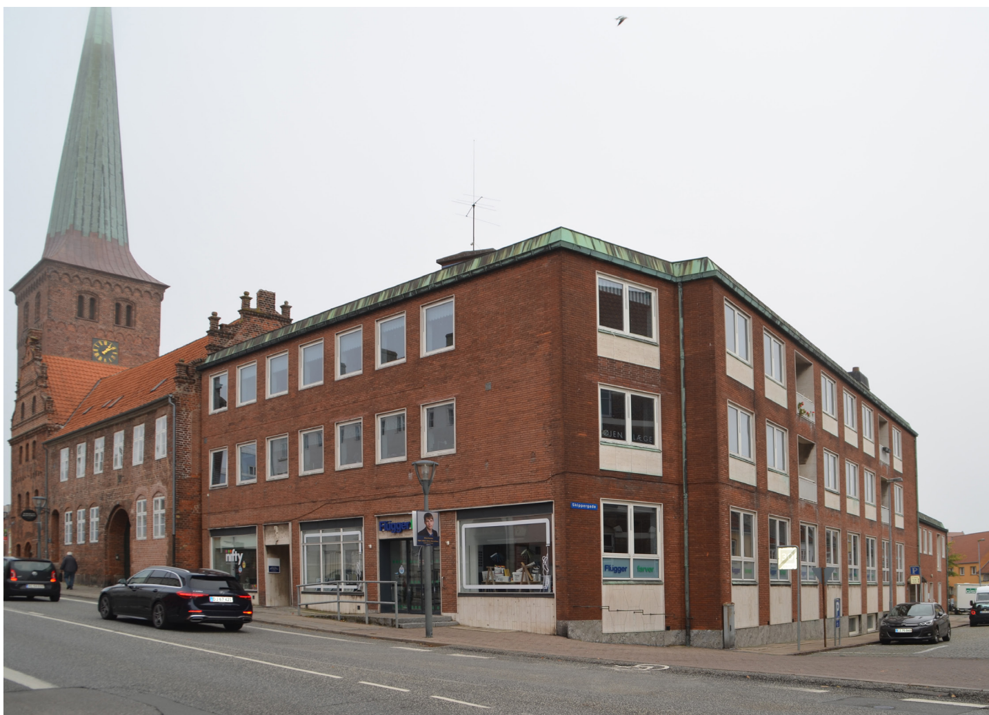
Adelgade 3 i 2022 med nye, hvidmalede vinduer.