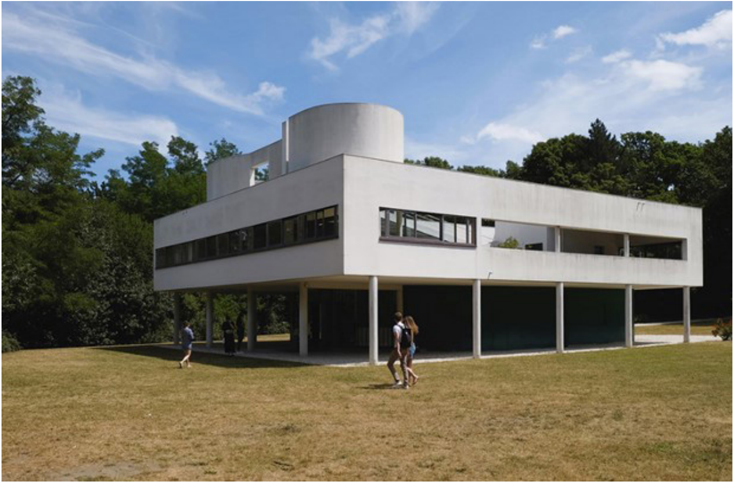
Villa Savoye opført 1928-31. Foto: Fernando Levis (Flickr, everyone's photos).