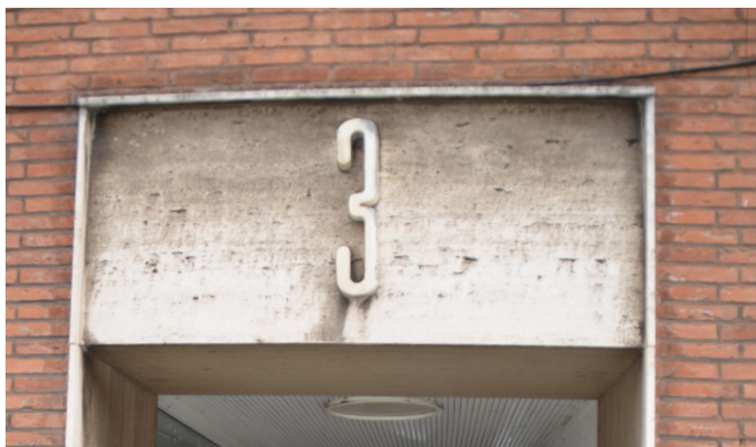
Skiltningen over indgangsparti: En funktionsbestemt udsmykning, et modernistisk ornament.

af lejemål, kun husnummeret ”3” står tilbage som minde om den tids funktionsbestemte udsmykning. Trods ændringer fremstår Adelgade 3 fortsat som et bevaringsværdigt eksempel på den nationale, funktionelle tradition i Nyborg.