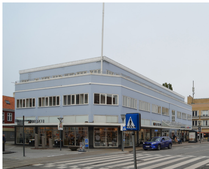
Gammel Torv 2 i 2022.

Det nye trapperum, der ud fra funktionelle hensyn er forsynet med et vertikalt vindue, bryder med den originale facadekomposition bestående af lutter horisontale vinduer. Derfor foreslås det, at man så vidt muligt reetablerer de horisontale vindue.