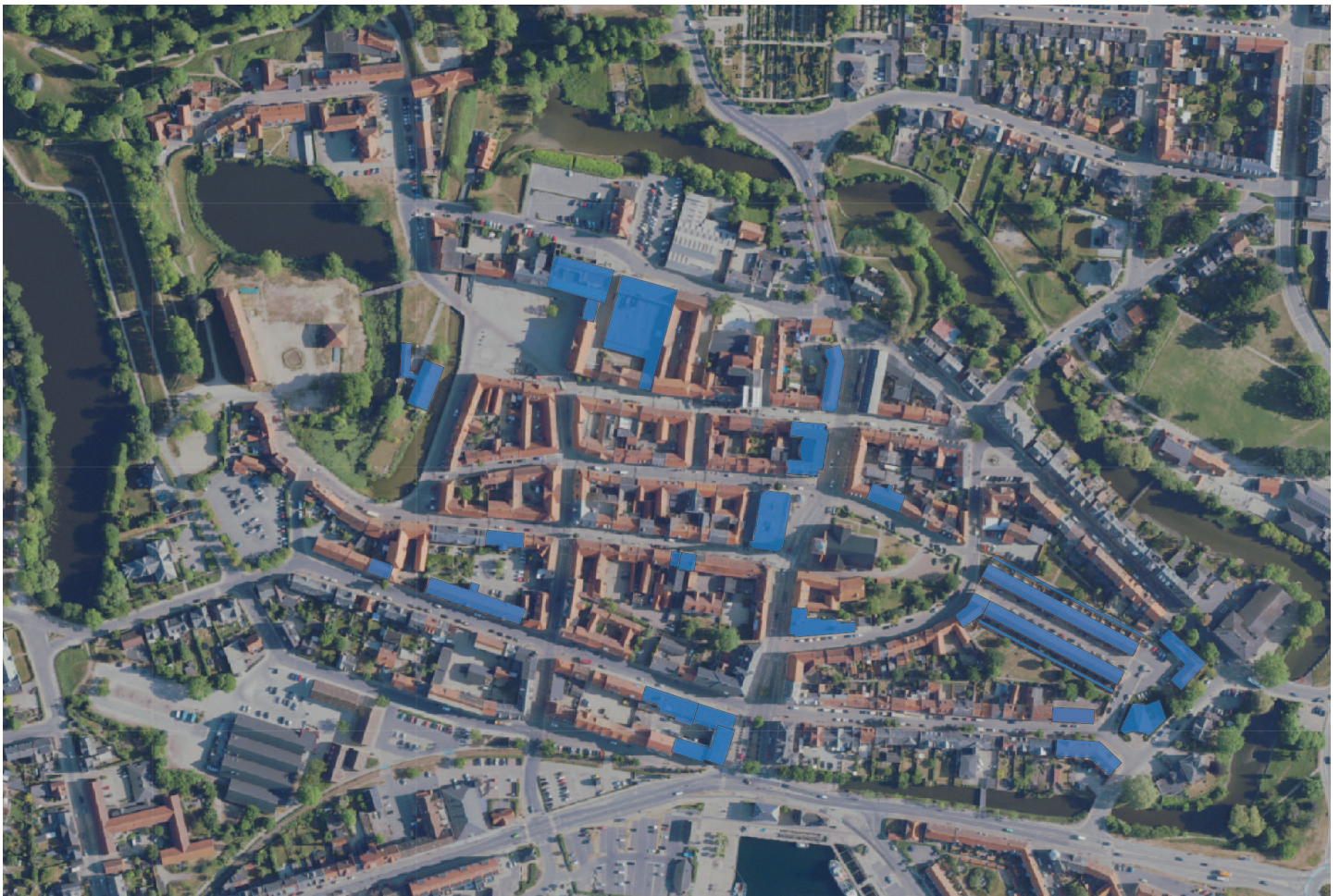
Oversigt over modernismens udbredelse i Nyborg bykerne.