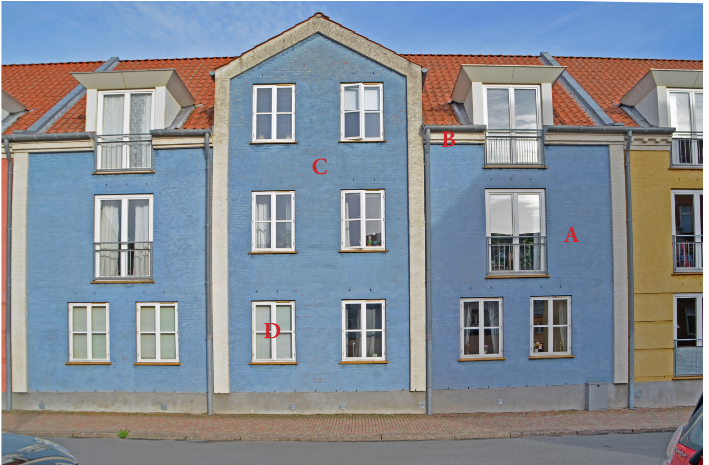
Facadeparti med gavlkvist.