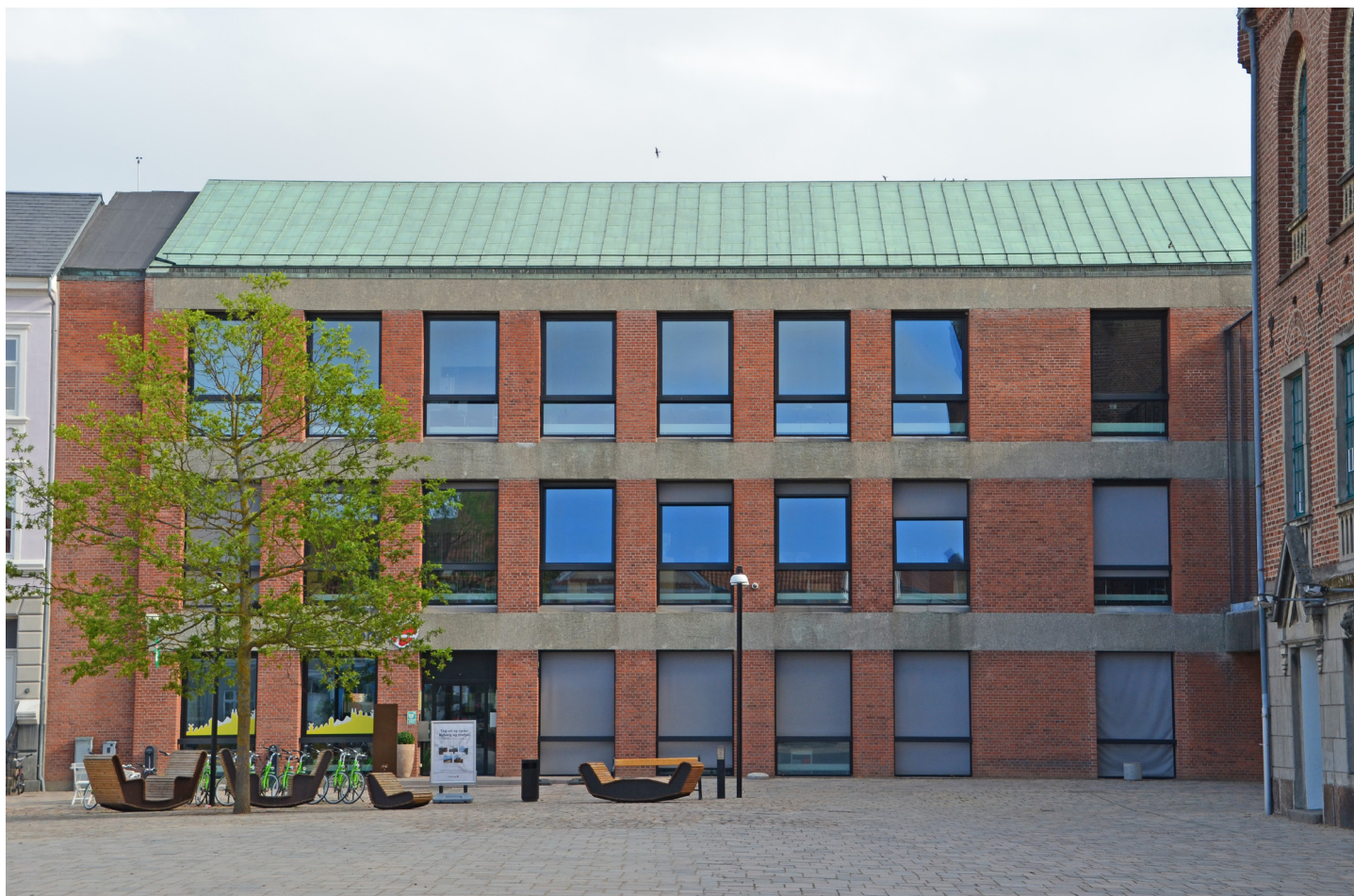
Rådhusstilbygningen 2022, forsiden mod Torvet.