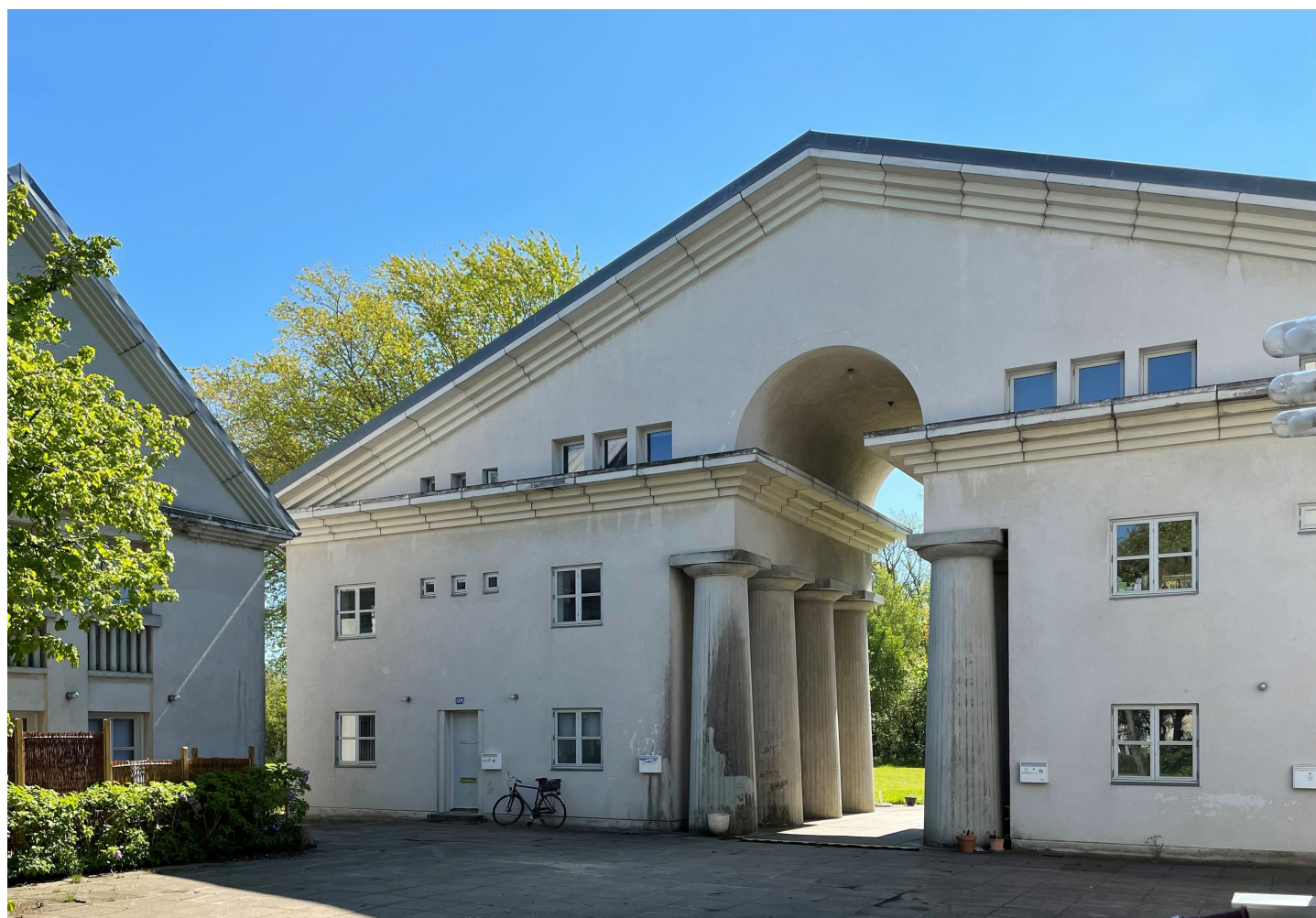
Porthus 2022 med fire lejligheder i Blangstedgård tegnet af arkitekt Poul Ingemann i forbindelse med byggeudstillingen Byg & Bo 1977.

Postmodernismen viste sig i Danmark i en ganske afdæmpet og nøgtern udgave. Undtagelsesvis kunne man dog i byggeudstillingen Byg & Bo i Blangstedgård ved Odense i 1977 se ægte postmodernisme i Poul Ingemanns porthus med fire lejligheder udformet med kraftige gesimser, doriske søjler og ikoniske, kvadratiske "amerikanervinduer" opdelt af et kryds i fire lige store ruder.