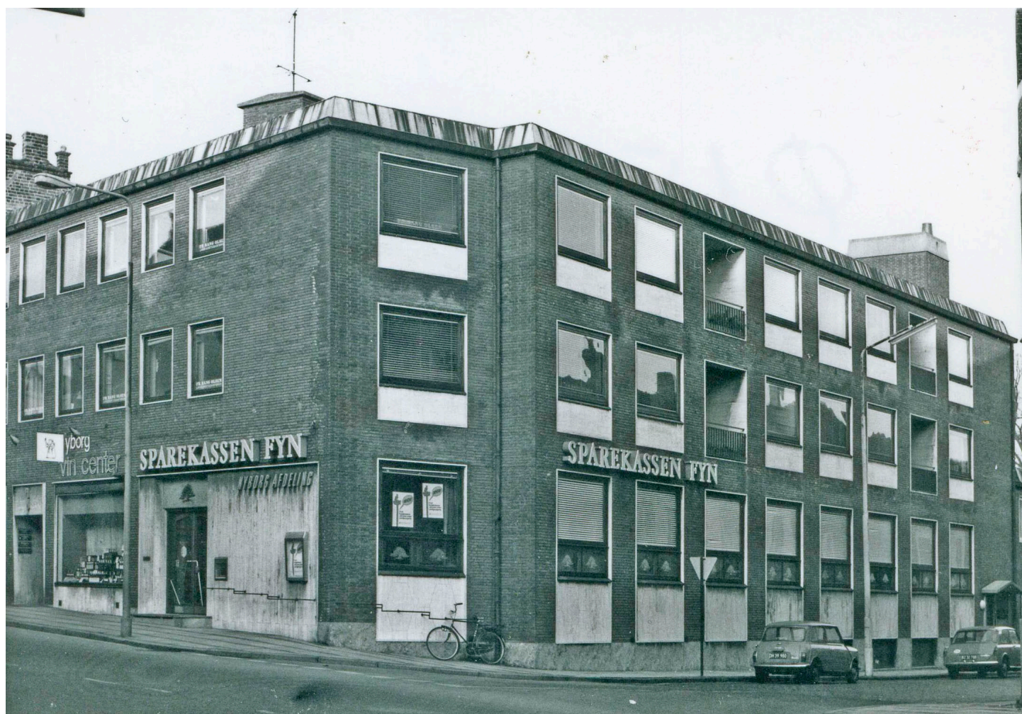
Adelgade 3 i 1975 med helrudevinduer i mørke rammer og modernistisk skiltning.

Skiltningen i form af omhyggeligt proportionerede bogstaver opsat på facaden var oprindeligt vigtige komponenter i facadekompositionen, men disse komponenter er gået tabt i forbindelse med ændringer