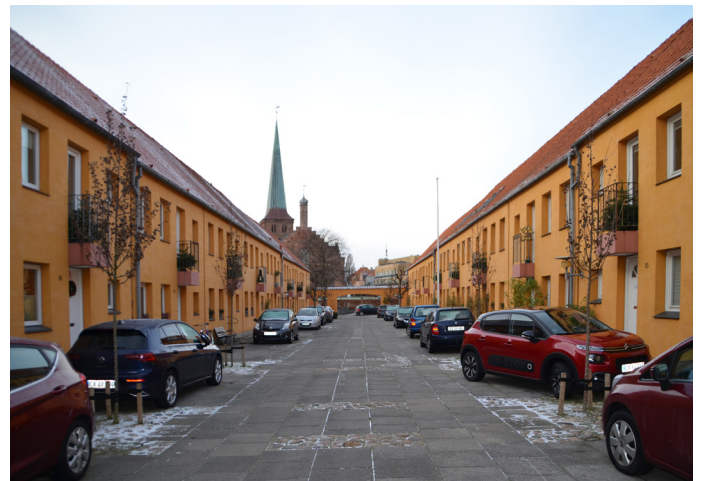
Nyenstad 2022: En gade kantet af købstadsrækkehuse i to etager med baghaver.