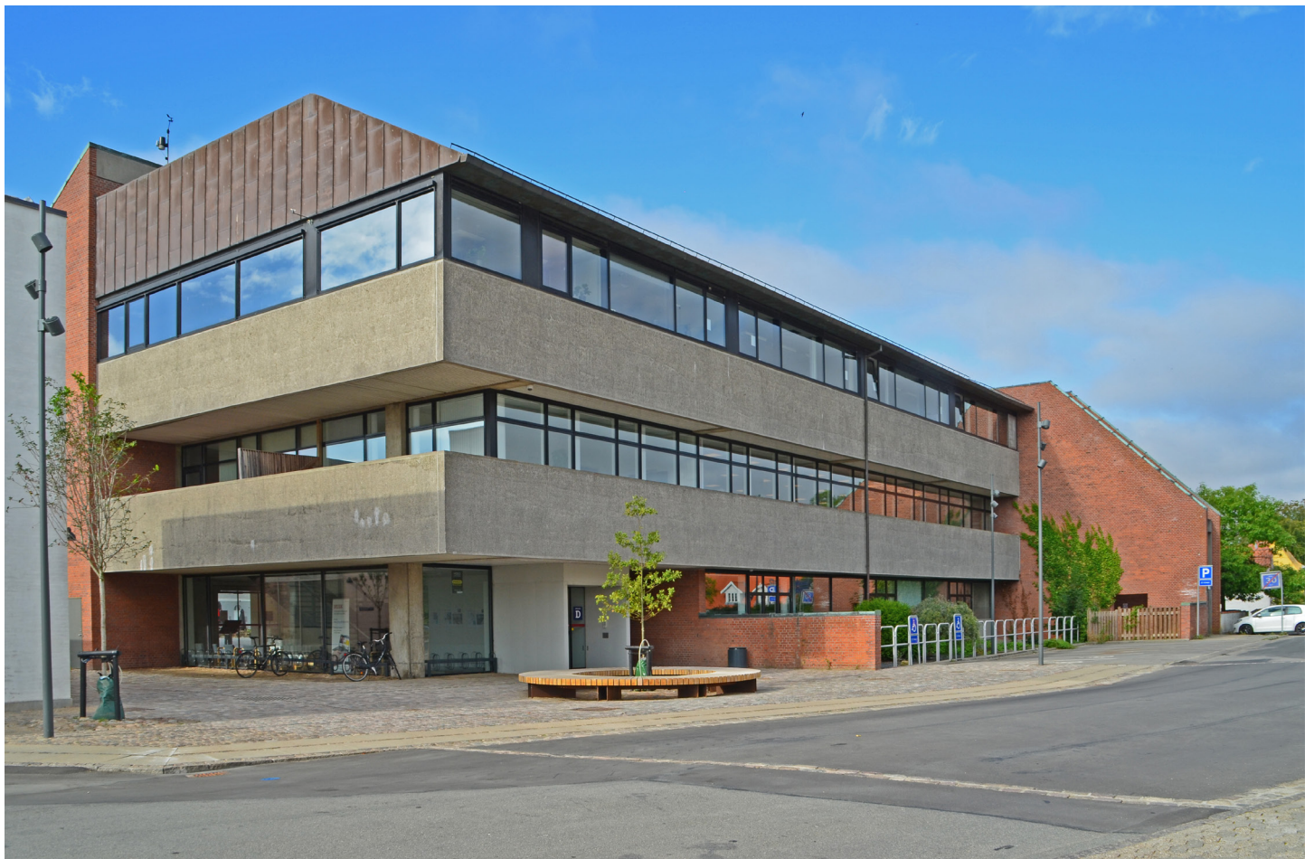
Rådhusbygningen 2022, forsiden mod Torvet.

Bagsiden mod Nørrevoldgade og Rådhuspassagen er helt forskellig fra forsiden. Bagsiden er domineret af to kraftige, horisontale betonbånd, der synes at svæve frit i rummet. Dermed udstråler bagsiden en dynamik i modsætning til forsidens klassiske ro. De to betonbrystninger afsluttes i hver ende af murflader af rødt tegl ligesom forsidens murflader. De mørke vinduesbånd bidrager til indtrykket af fritsvævende betonbånd.