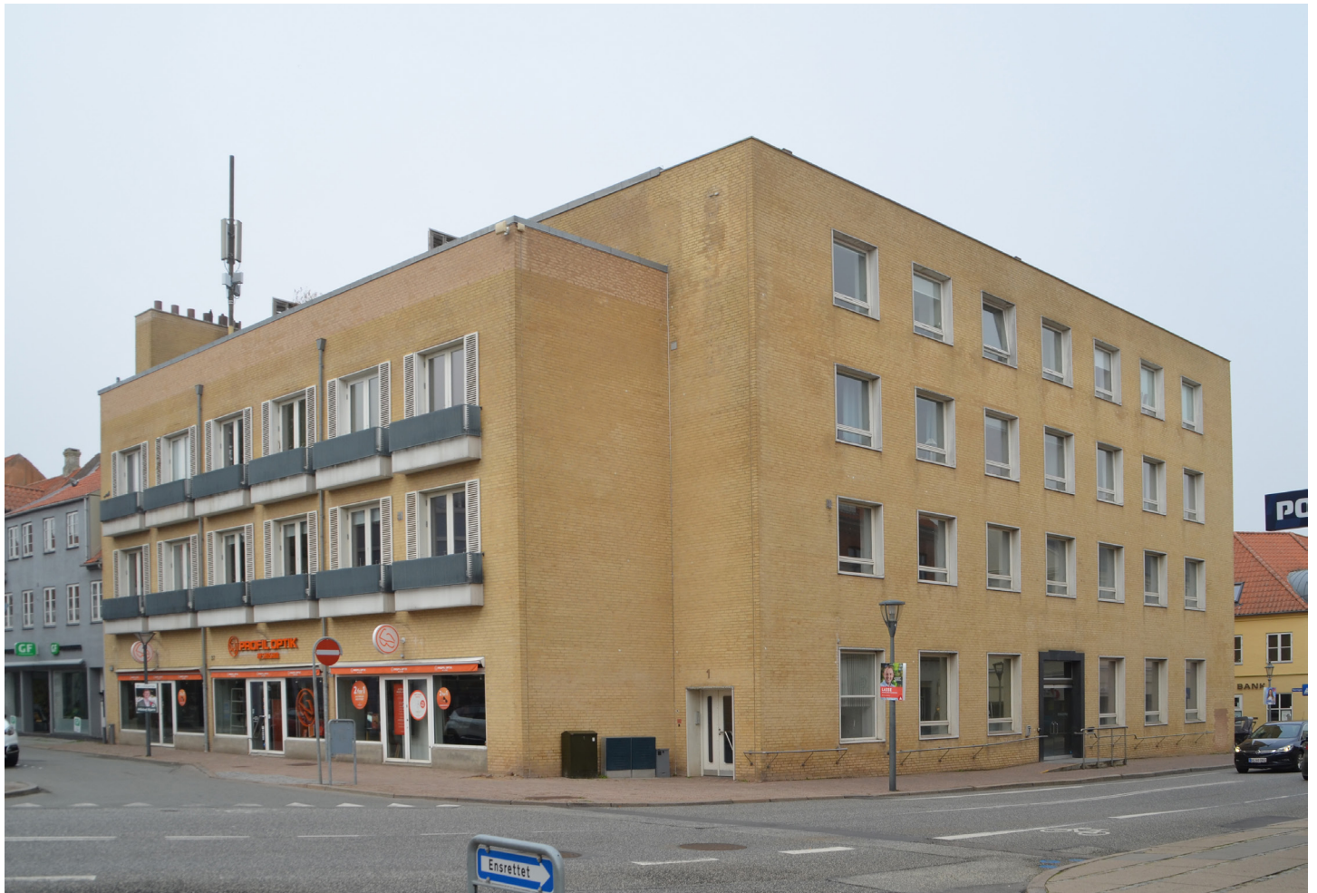
Baggersgade 1, 2022.

uskiftet med skalmur af gule mursten, og foldeskodderne blev erstattet af fastmonterede pynteskodder. Vinduerne, terrassedørene og deres lysninger blev ændret fra sorte til hvide, og således forsvandt de fleste af husets modernistiske kvaliteter.