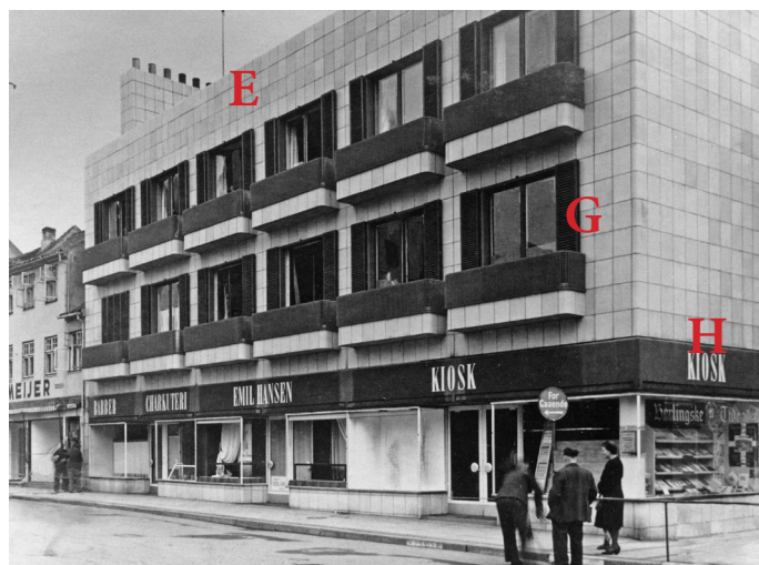
Baggersgade 1 1944 med foldeskodder, der her ses udfoldet i yderste lejlighed på 1. sal.

Fælles for de to bygninger kan man ud fra ældre billeder pege på en række markante stiltræk og formsprog: