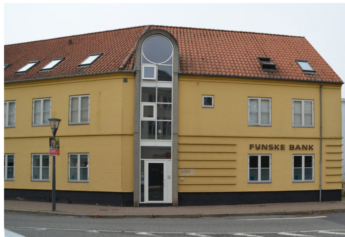
Baggersgade 7, 2022.

Som helhed er facaden et eksempel på vellykket indpasning af nybyggeri i et klassicistisk bymiljø.