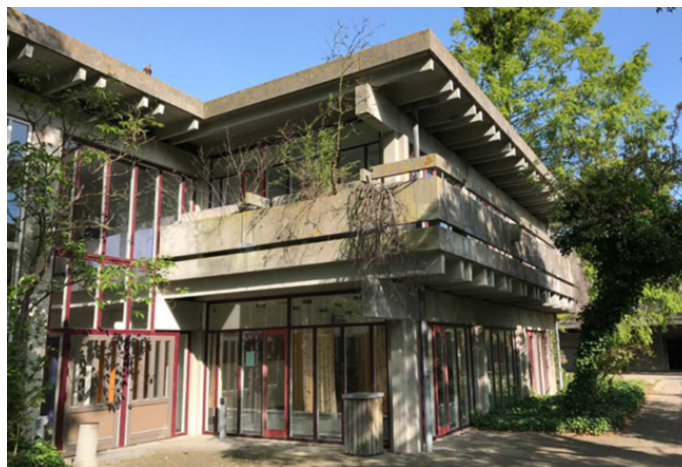
Strandvænget ved Skaboeshusevej, opført 1972, nu nedrevet. Arkitekt: Jens Malling Pedersen.

Brutalismen var en populær stilart fra 1950'erne frem til 1980'erne. I Nyborg opførtes samtidig med rådhusstilbygningen fra 1972 Strandvænget ved Skaboeshusevej; en særdeles vellykket brutalistisk bebyggelse i jernbeton tegnet af arkitekt Jens Malling Pedersen, Vejle, men nu for størstedelen nedrevet.