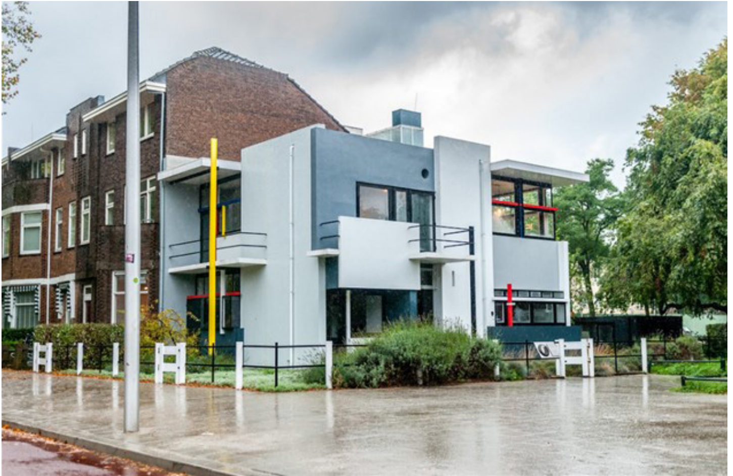
Rietveld Schröder House opført 1924.