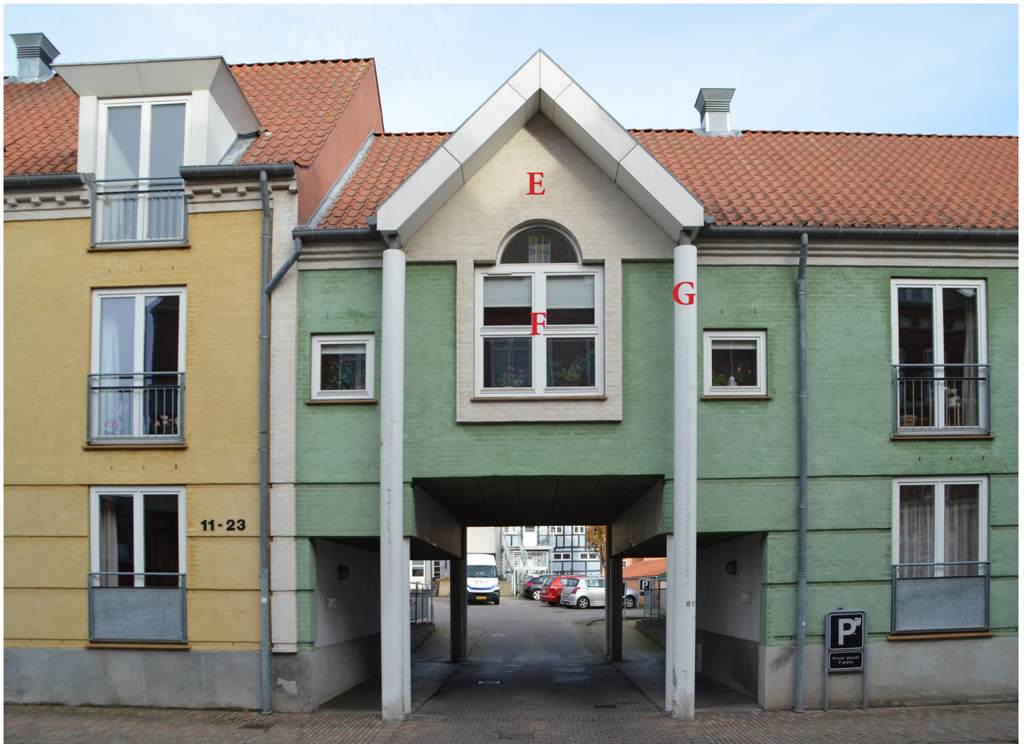
Porten og hovedindgangen til bebyggelsen.