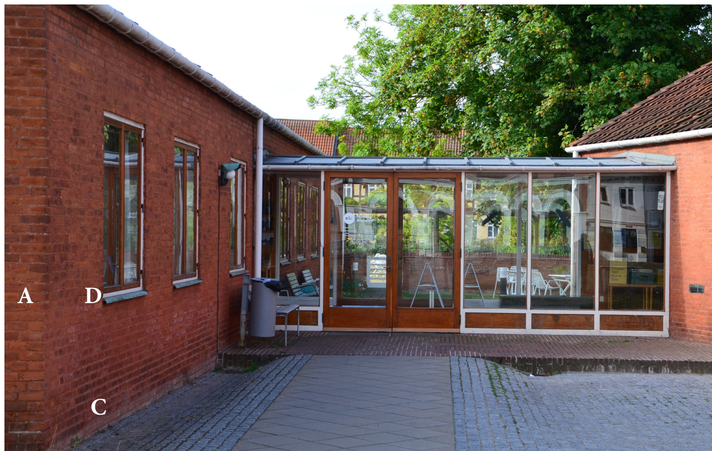
Nyborg Bibliotek 2022 med hovedfløjen t.v. og indgangspartiet i baggrunden.

Omhyggelig detaljering og materialevalg. F.eks. Er sølbænke af kobber, der står smukt til den røde teglsten, og sølbænkene er forsynet med "endebund" og uden anvendelse af elastisk fugemasse.