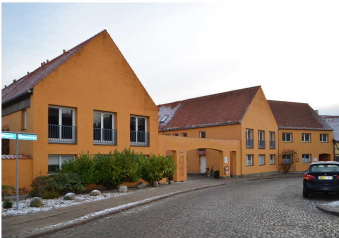
Nyenstad 2022 med facade og portal mod Skippergade.

Det arkitektoniske formsprog i Nyenstad er således i høj grad et resultat af respekt for "stedets ånd". Men arkitekturen kan også ses som en genoptagelse af den nationale funktionelle tradition. Gavlene er skarptskårne uden gesimser eller udhæng og facaderne er renfærdige uden detaljer og pynt. Kun helhedsindtrykket og portalen ud mod Skippergade giver mindelser om fortiden.