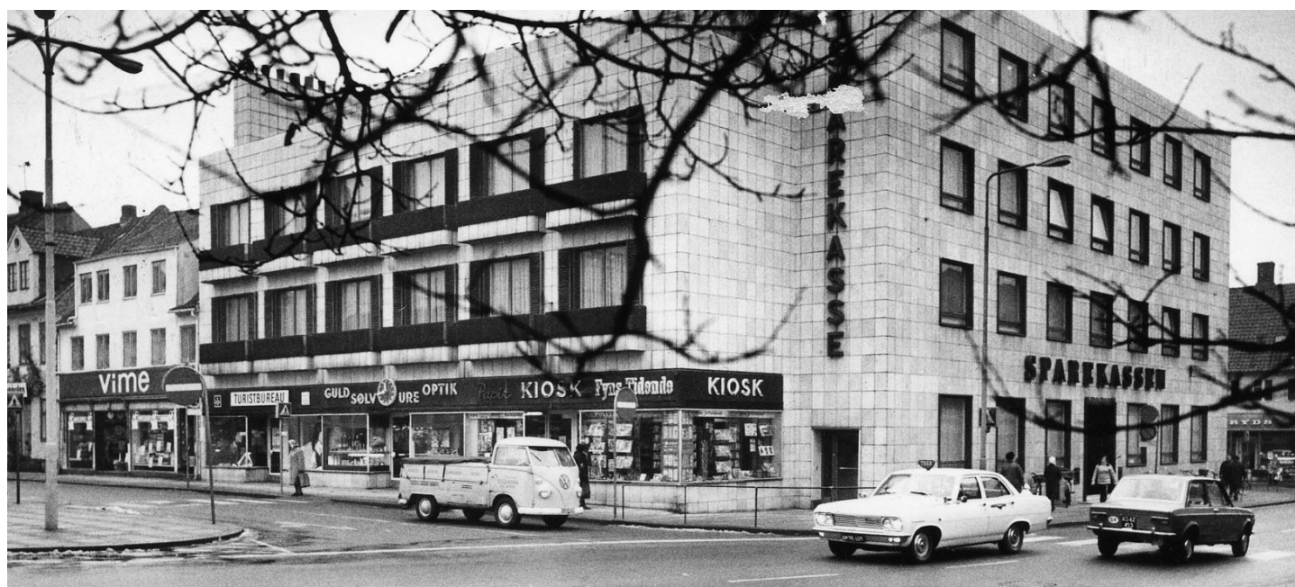
Baggersgade 1 omkring 1970.